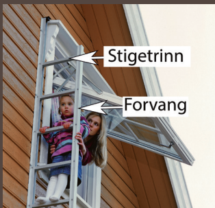
Vippe- eller glidehengslet vindu